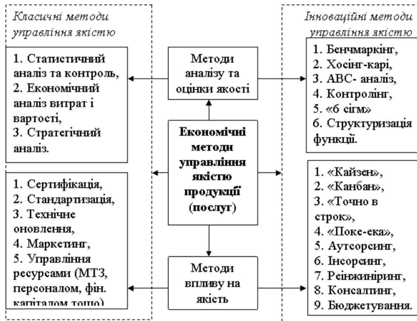
Рис 1. Класифікація економічних методів управління якістю продукції (послуги)