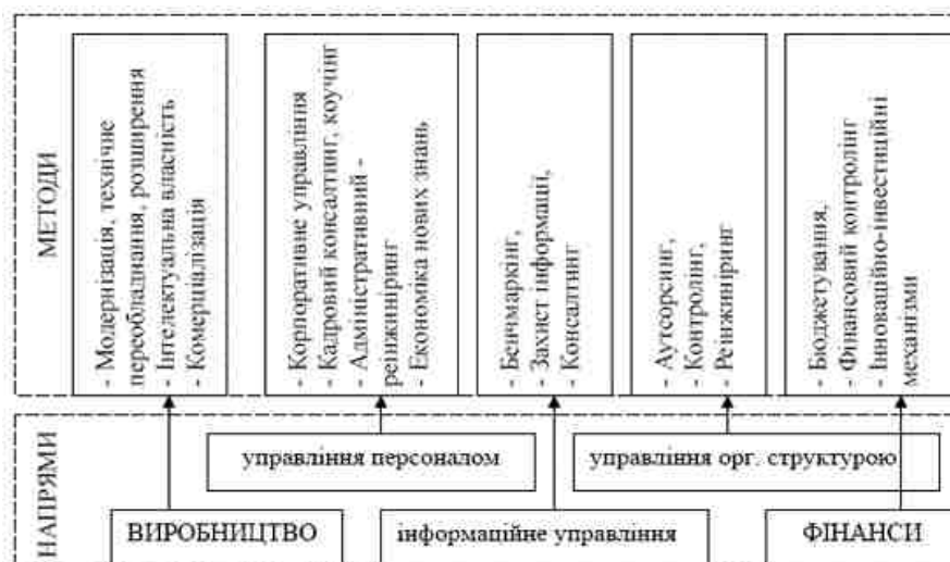
Рис 2. Класифікація інноваційних методів управління якістю за напрямками діяльності підприємства

З метою спрощення процесу прийняття управлінських рішень сучасні економічні методи управління якістю доцільно систематизувати за напрямками діяльності підприємства (рис. 2).