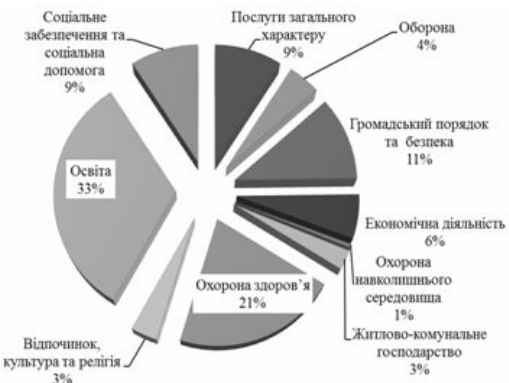
Рис. 3. Структура кінцевих споживчих витрат сектору ЗДУ за функціями у 2011 році, у відсотках до загального підсумку

Додатковим підтвердженням цього є статистична інформація щодо структури кінцевих споживчих витрат сектору ЗДУ відповідно до функцій у 2011 році (див. рис. 3). Найбільшу питому вагу у витратах сектору ЗДУ складають саме індивідуальні споживчі витрати (охорона здоров'я та освіта), найменшу – охорона навколишнього середовища.