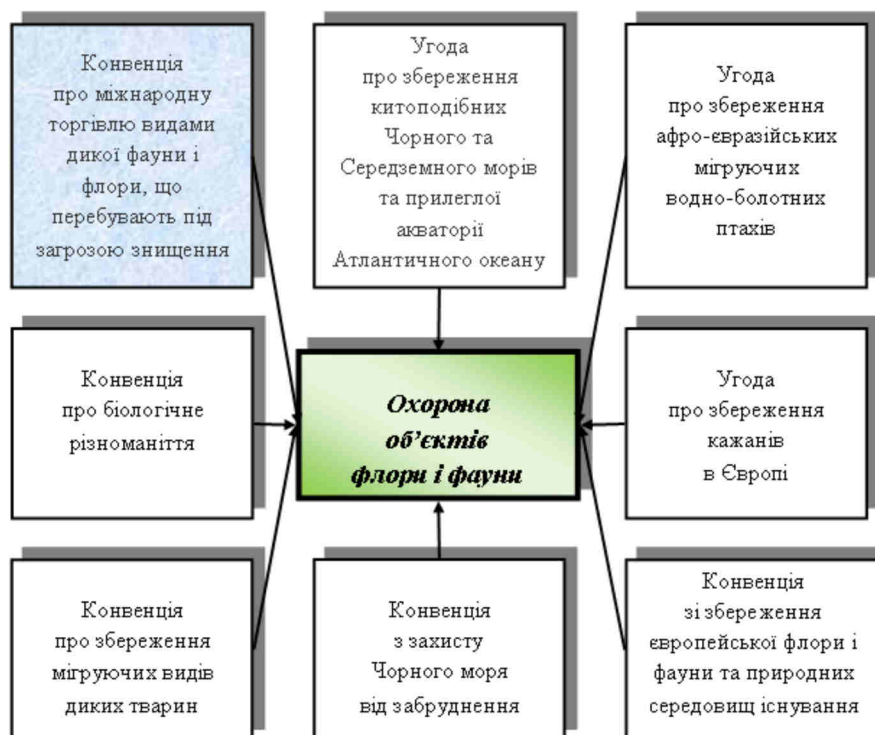
Рис. 1. Основні міжнародні конвенції та угоди Організації Об'єднаних Націй з охорони навколишнього середовища, найбільш актуальні для України (згідно з інформацією з джерела [1])

Серед різних міжнародно-правових документів у цій сфері (рис. 1) найбільш важливим для України по праву вважається Конвенція про міжнародну торгівлю видами дикої фауни і флори, що перебувають під загрозою знищення (СІТЕС).