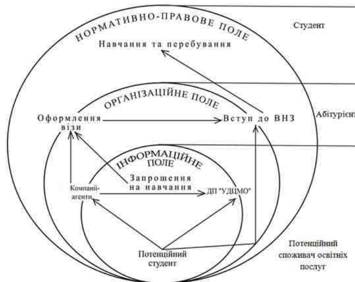
Рис. 2. Навчання іноземних студентів в Україні (загальна схема)

У спрощеному вигляді найпоширеніша практика характеризується двома алгоритмами. По-перше, це алгоритм «мати бажання → отримати запрошення → оформити візу → бути зарахованим → навчатися в Україні». По друге, це алгоритм, коли потенційний споживач не потребує оформлення візи, тобто необхідність отримати запрошення відпадає, достатнім є прибути до навчального закладу та за результатами вступу буди зарахованим на навчання до бажаного ВНЗ.