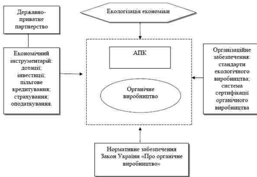
Рис. 2. Організаційна модель органічного виробництва

Сутність даної моделі полягає в поєднанні організаційно-економічних, нормативних інструментів на основі інтеграції управлінських процесів і технологій, використання яких надасть можливість забезпечити збалансований розвиток галузі, формування внутрішнього і зовнішнього ринку високоякісної безпечної органічної продукції і підвищення конкурентоспроможності АПК.