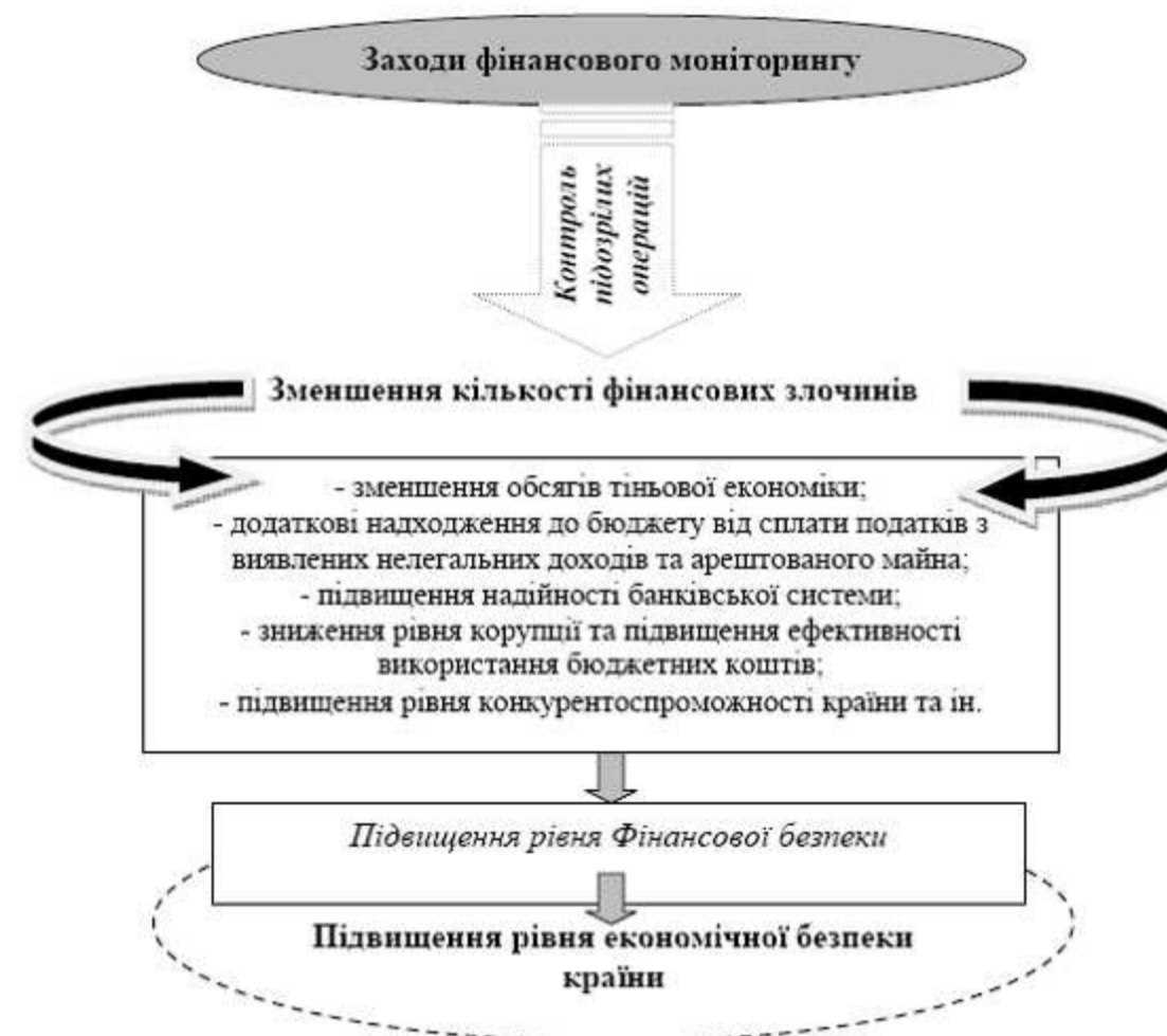
Рис. 3. Механізм впливу заходів у сфері фінансового моніторингу на економічну безпеку держави

На сьогодні механізми легалізації злочинних доходів пронизують майже всі галузі народного господарства. Саме тому важливим аспектом в діяльності підрозділів фінансових розвідок, що підвищує рівень економічної безпеки держави, є виявлення, відстеження та ліквідація схем відмивання незаконних доходів. Механізм впливу заходів у сфері фінансового моніторингу на економічну безпеку держави відображений на рис. 3.