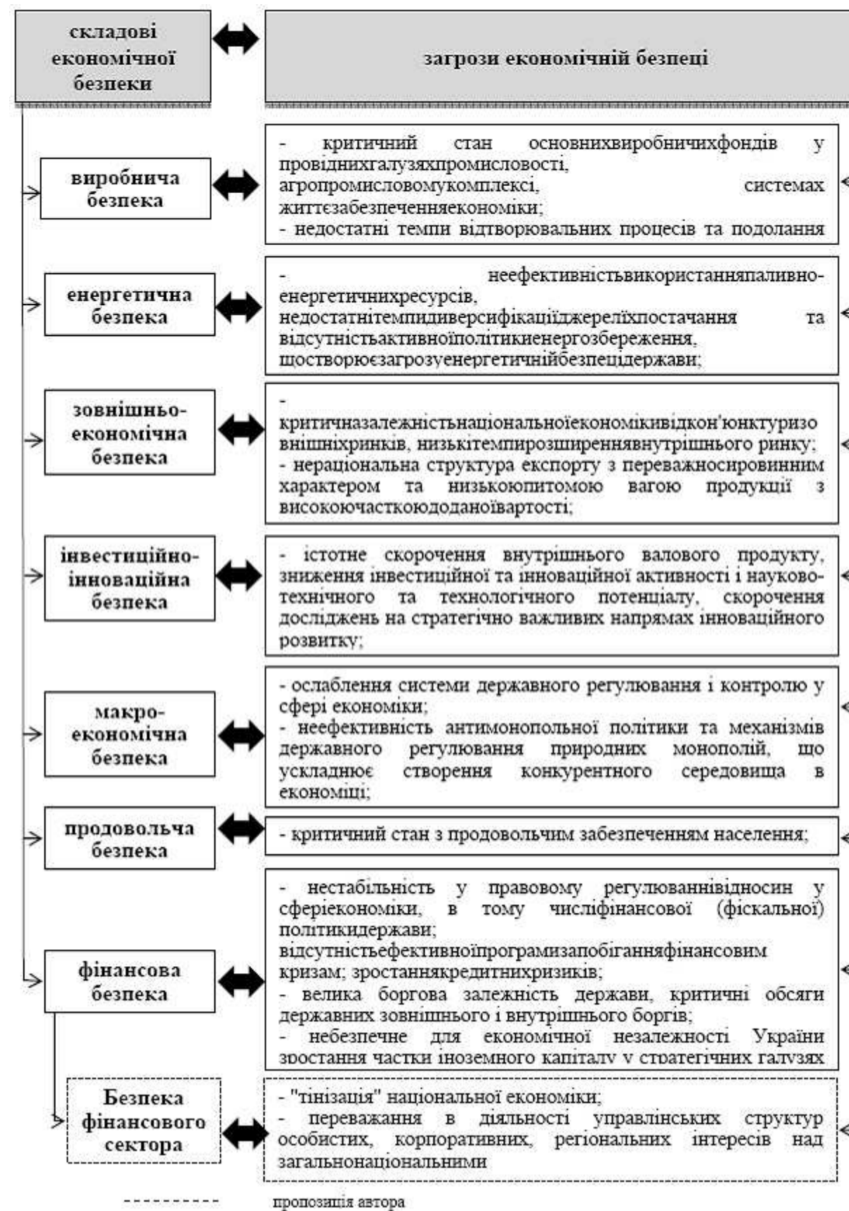
Рис. 2. Відповідність загроз економічній безпеці держави її складовим

Тому пропонуємо в межах фінансової безпеки виділити складову “безпеку фінансового сектора (операцій)”, відповідно до якої при визначенні рівня економічної безпеки України будуть враховуватись загрози, пов’язані з легалізацією злочинних доходів. Ця складова дозволить враховувати загрози, пов’язані з легалізацією злочинних доходів, та приймати відповідні рішення щодо її попередження, що дозволить підвищити як ефективність фінансового моніторингу, так і рівень економічної безпеки.