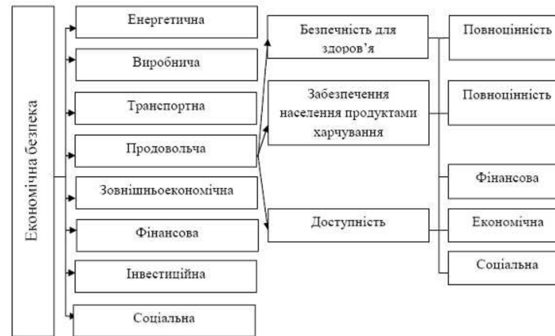
Рис. 1. Продовольча безпека в структурі економічної безпеки держави

Необхідність включення механізму державного регулювання в систему продовольчого забезпечення обумовлена значимістю продовольчого забезпечення для соціально-економічного розвитку регіону. Основним завданням системи державного управління є підтримка стабільної економічної ситуації в сільському господарстві, стабілізація ринкової кон'юнктури і коливань прибутковості в галузі.