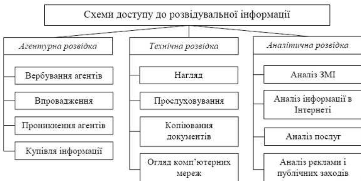
Рис. 1. Схема доступу до розвідувальної інформації при здійсненні конкурентної розвідки (подано за А.А. Торокіним [2])

Весь інформаційний простір можна підрозділити на такі типи інформації, як «відкриту» (для вільного й офіційного доступу), «закриту» (тобто складає комерційну чи державну таємницю) та «слухову» (що передається неофіційно в усній формі). Тому, з метою розвідування, існують різні схеми доступу до інформації: «агентурна розвідка» (конфіденційна), «технічна розвідка» (таємнича), «аналітична розвідка» (цілком легальна) (рис. 1).