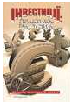
Журнал «Інвестиції: практика та досвід»