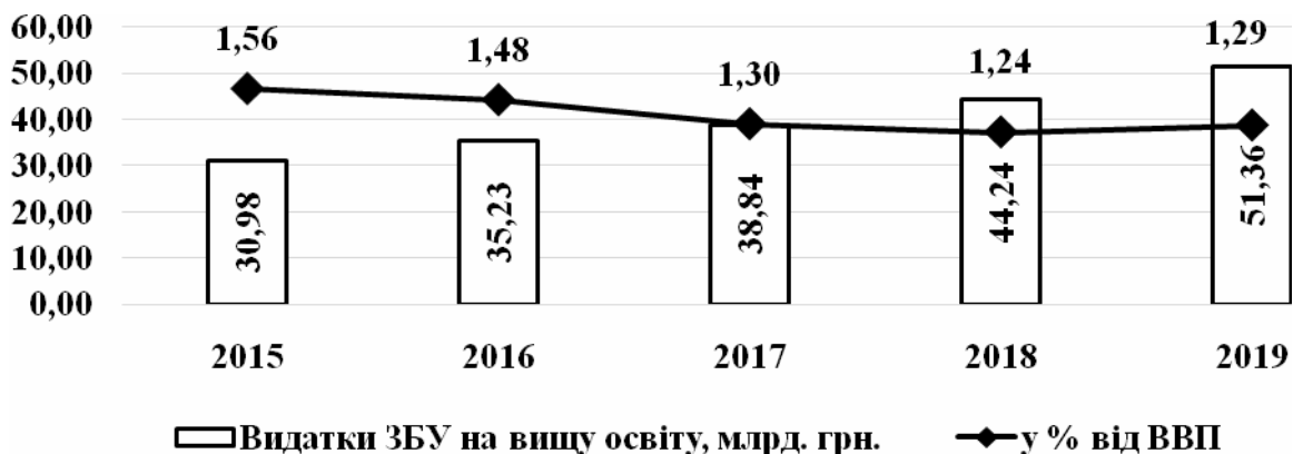
Рис. 2. Динаміка видатків зведеного бюджету України на вищу освіту

У абсолютному вимірі в 2019 році спостерігається підвищення видатків ЗБУ на освіту на 28,73 млрд грн. у порівнянні з 2018 роком. Разом з тим, фінансування вищої освіти залишається нестабільним і демонструє певне зниження. Так, у 2019 році у відсотковому вираженні воно зросло на 0,05 %, але якщо порівнювати з 2015 роком, то спостерігається зменшення на 0,27% (рис. 2).