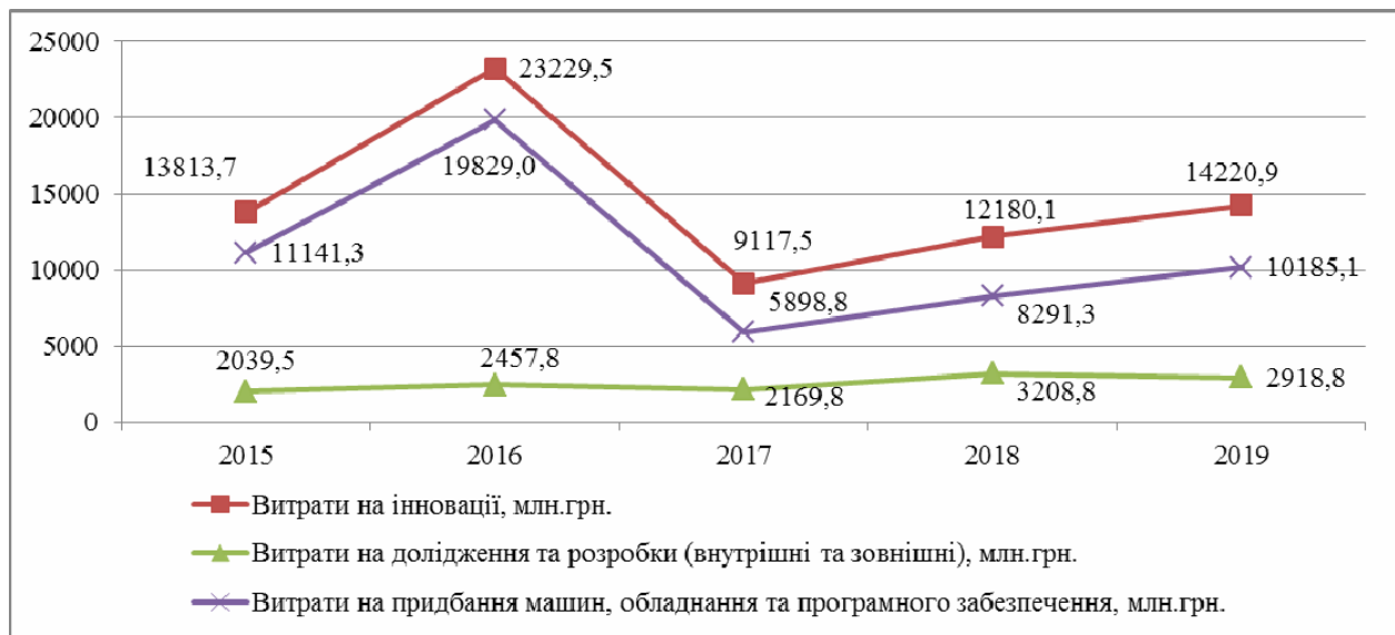
Рис. 4 Динаміка загального обсягу витрат за напрямками інноваційної діяльності промислових підприємств України у 2015-2019 роках (побудовано авторами за [7])

Розвиток виробничого сектору економіки також все більше базується на використанні інформації та знань, інноваціях, впровадженні нові техніки та технологій, та залежить від них. Новітні глобальні економічні процеси є наслідком використання знань, інформації, інновацій, людського капіталу розвитку інтелектуального потенціалу як окремих суб'єктів господарювання, так і національних економік в цілому. Підвищення національної конкурентоспроможності України в умовах економіки знань можливе завдяки використанню вітчизняного інтелектуального потенціалу, підвищенню якості освіти, впровадження національних програм розвитку наукових шкіл і наукомістких галузей економіки, активізації співпраці між закладами вищої освіти, науково-дослідними установами та підприємствами з метою найшвидшого впровадження новітніх розробок та ідей у виробничий процес.