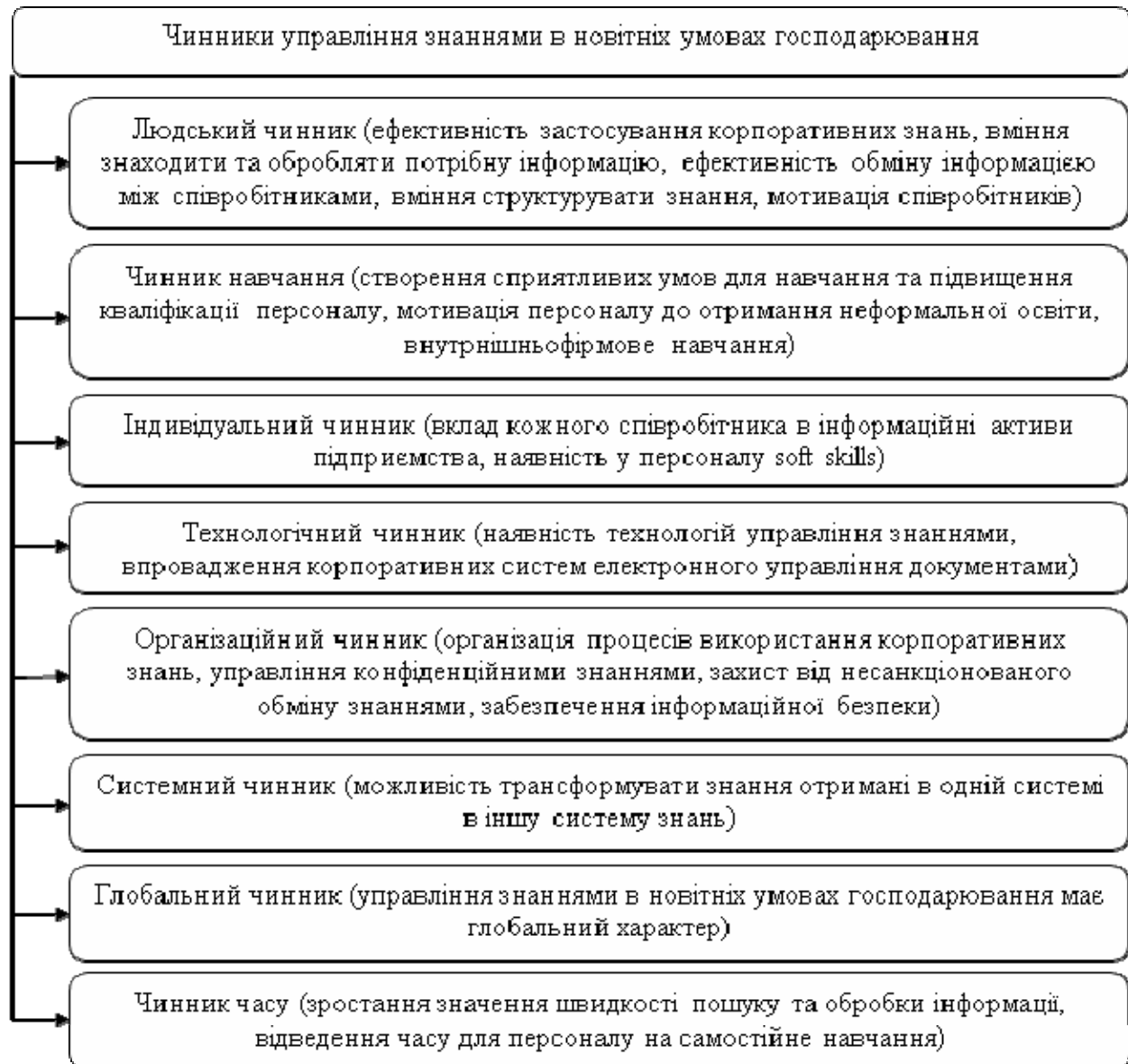
Рис. 1. Чинники управління знаннями в новітніх умовах господарювання (побудовано авторами на основі [8])

В новітніх умовах інформаційної економіки управління знання є особливо цінним активами та одним з ключових чинників успішного функціонування підприємства на ринку. Важливим аспектом управління знаннями є їх перенесення з пасивного стану (стану ідеї) до практичної діяльності (реального впровадження).