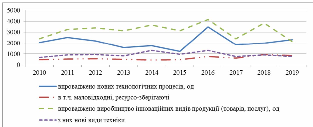
Рис. 3. Динаміка впровадження інновацій на промислових підприємствах України у 2010-2019 роках (побудовано авторами за [7])

Не зважаючи на високий науковий потенціал України, динаміка кількості працівників, задіяних у виконанні наукових досліджень і розробок протягом 2010-2019 років є негативною. У 2019 році порівняно з 2010 роком кількість таких працівників знизилась на 103222 особи або на 56,6%, тобто більше, ніж на половину.