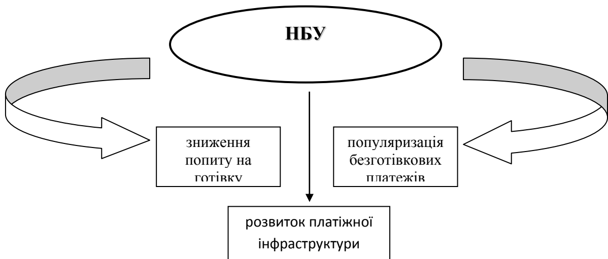
Рис. 1. Напрями діяльності Національного банку України

Оскільки на даний момент ринок віртуальних грошей успішно діє, то все більше користувачів здійснюють операції з криптовалютою. Внаслідок цього незабаром звичний нам грошовий обіг може замінитись безготівковим. Тож зважаючи на це, заходи державних органів України спрямовані на розвиток безготівкової економіки (Рис.1).