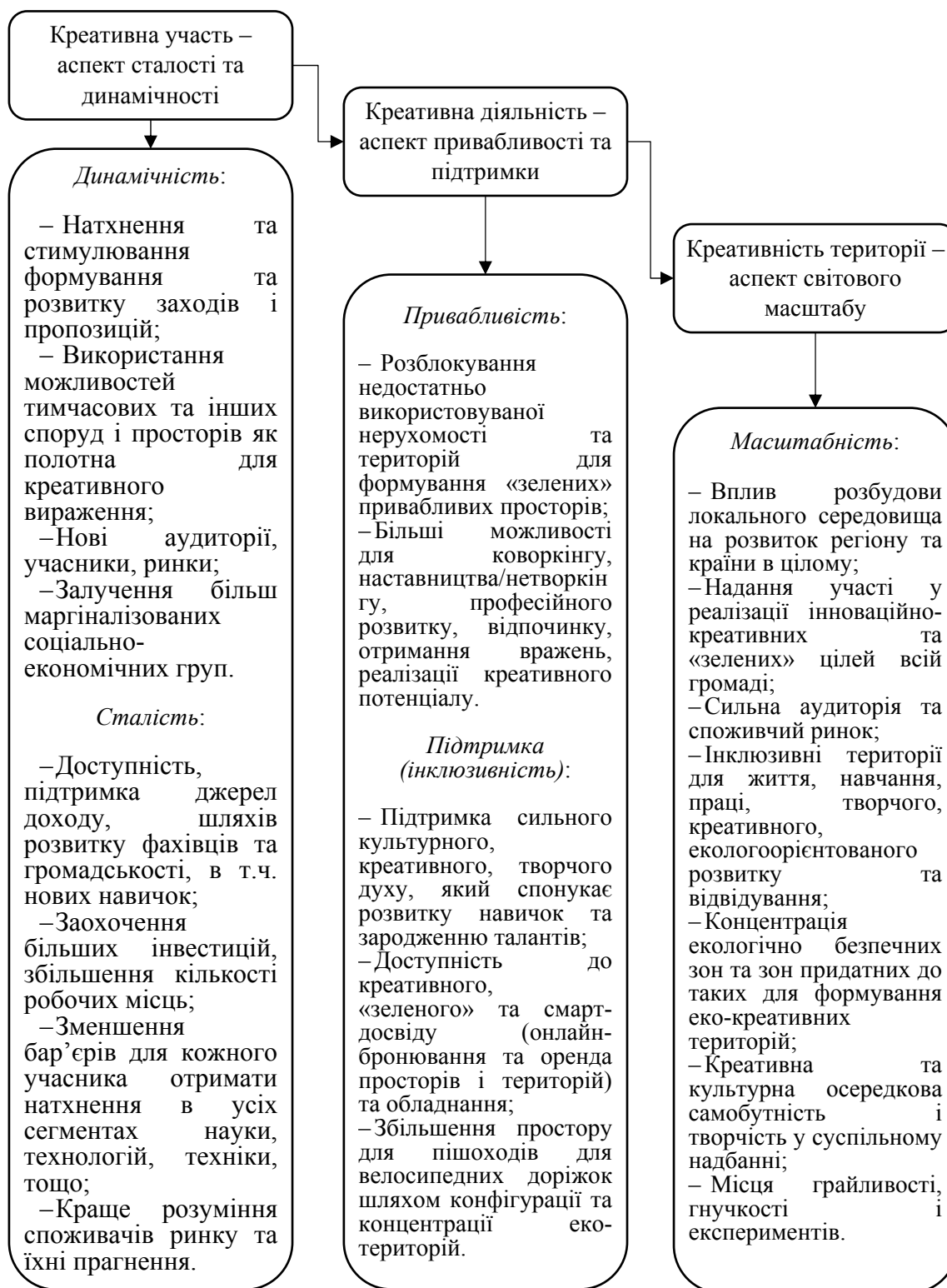
Рисунок 2. Схема обґрунтування відповідності ідеї формування еко-креативних територій як елементу досягнення сталості та інклюзивності