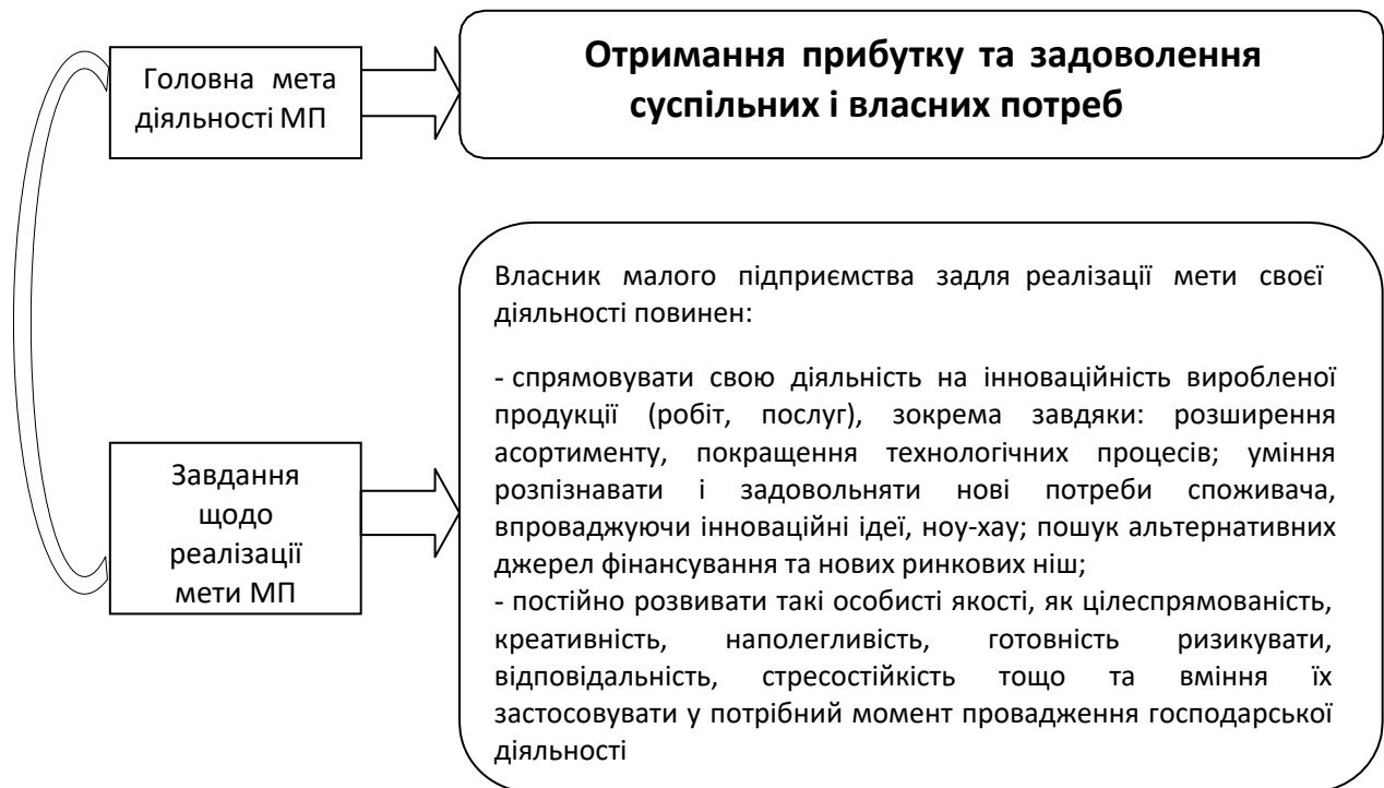
Рис. 1. Характеристика мети та завдань малого підприємства

якостей та їхніх організаторських здібностей здійснює господарську діяльність за для задоволення суспільних та особистих потреб, а також отримання максимального прибутку із мінімальними затратами виробничих факторів.