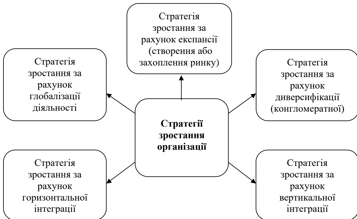
Рис. 1. Стратегія зростання організації [4, с. 49-58]

Стратегії зростання організації відбуваються за рахунок: експансії, диверсифікації, глобалізації діяльності (рис. 1.).