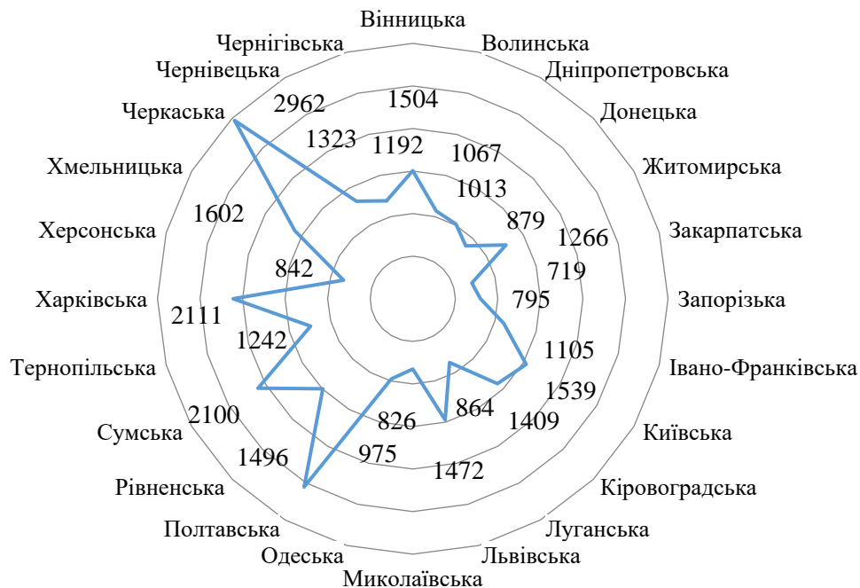
Рис. 2. Середній розмір плати за оренду сільськогосподарських земель у розрізі регіонів України в 2017 році, грн/га