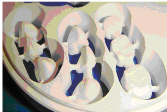
Рис. 2. Виготовлення ортопедичних конструкцій за допомогою фрезувального апарата