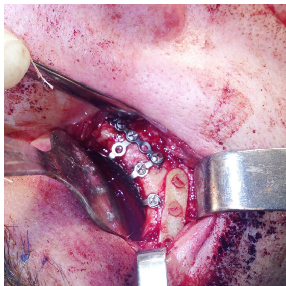
Рис. 1. Хворий П., 28 років. Діагноз: травматичний перелом правої виличної кістки, поєднаний із дефектом дна правої орбіти. Етап операції – полімеростеосинтез у ділянці тіла виличної кістки поблизу нижньо-орбітального краю

У 11 (91,7 %) пацієнтів основної групи з переломами та деформаціями НЩ отримано задовільний результат хірургічного лікування, що клінічно і рентгенологічно підтверджено через 1 міс після операції. Ускладнень запального характеру в післяопераційному періоді не спостерігали. Консолідація з'єднаних кісткових фрагментів відбувалася вчасно. В 1 (8,3 %) пацієнта з незрошеним переломом у ділянці підборіддя в умовах нефіксованого прикусу (без іммобілізації НЩ) полімеростеосинтез двома ЕПУ-ГАП-ЛЕВ-пластинами й гвинтами був неефективним. У післяопераційному періоді відбулося зміщення фрагментів на 4 мм по висоті, що пов'язано з невідповідністю параметрів фіксатора умовам функціонального навантаження (рис. 1, 2).