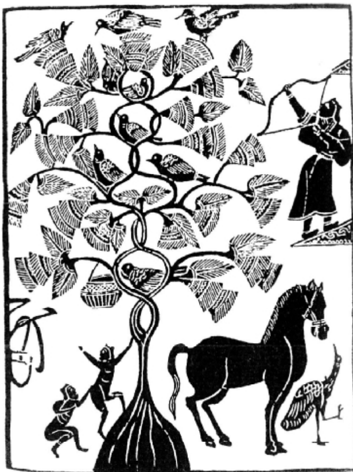
Рис. 1. Китайське дерево Фусан.

Універсальність символу Світового Дерева, як міфологічного образу, що протягом тривалого часу визначав модель світу в багатьох культурних традиціях є беззаперечною. Це один з небагатьох орнаментів, що так само чудово зберігся і в українській традиції, що підтверджено незліченною кількістю його зображень на домашньому начинні, посуді, керамічних виробих, писанках, вишивках, рушниках тощо. Як і для більшості народів, Світове дерево для українців є своєрідним зразком космоустрою, переходом від хаосу до упорядкованого світу. В різні часи образ набував нових ширших значень – це і центральна вісь світу, що сполучає Небо і Землю, і цикли життя, смерті і відродження, таємничі закони буття. Однак цілком зрозуміло, що які б форми він не приймав та якими б зображеннями не передавався сутність даного символу лишається незмінною та єдиною для всіх – возвеличення сили життя у всіх його проявах та трансформаціях.