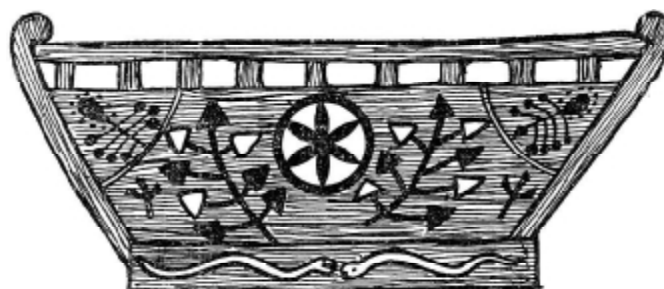
Рис. 2. Ідеограма "Світового дерева" на спинці саней (різьблення, розпис). Уманщина.