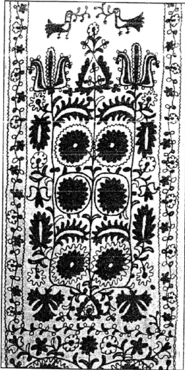
Рис.3. Світове дерево, увінчане тризубами (вишивка). Черкаси.