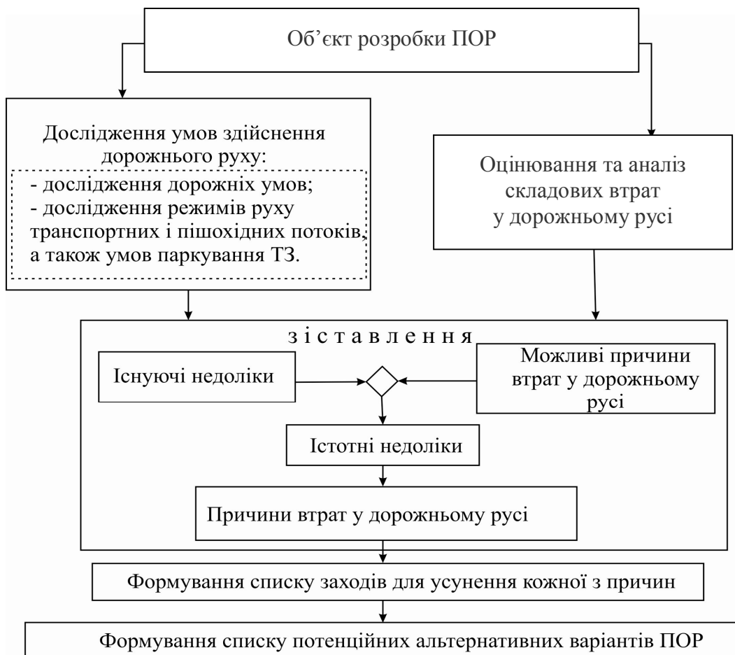
Рис. 1. Процес формування списку альтернативних варіантів проекту організації дорожнього руху

Етап 1. Процес формування списку альтернативних варіантів ПОР на об'єкті проектування недостатньо формалізований і мало описаний точними методами досліджень. Список потенційних альтернативних варіантів ПОР на об'єкті проектування рекомендується складати на основі дослідження причин втрат у дорожньому русі (рис. 1).