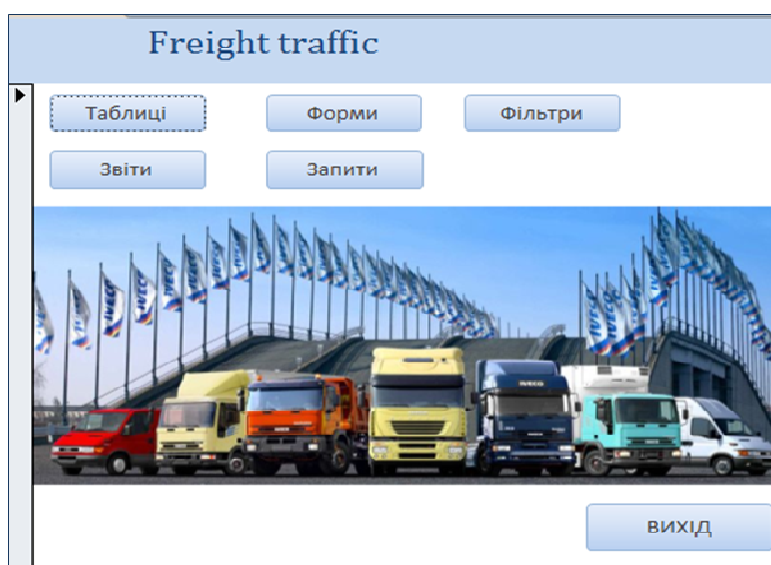
Рис. 7. Головна сторінка Freight traffic

Кнопкові форми містять кнопки, що дозволяють обирати основні функції або підсистеми додатку. Кнопкова форма запропонованої БД «Freight traffic» наведена на рис. 7.