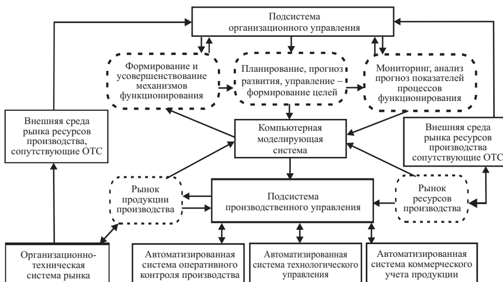
Рис. 1. Структура организационно-технической системы

технического назначения, продукция которых реализуется на конкурентных рынках, включает постановку и комплексное решение следующих взаимосвязанных задач: