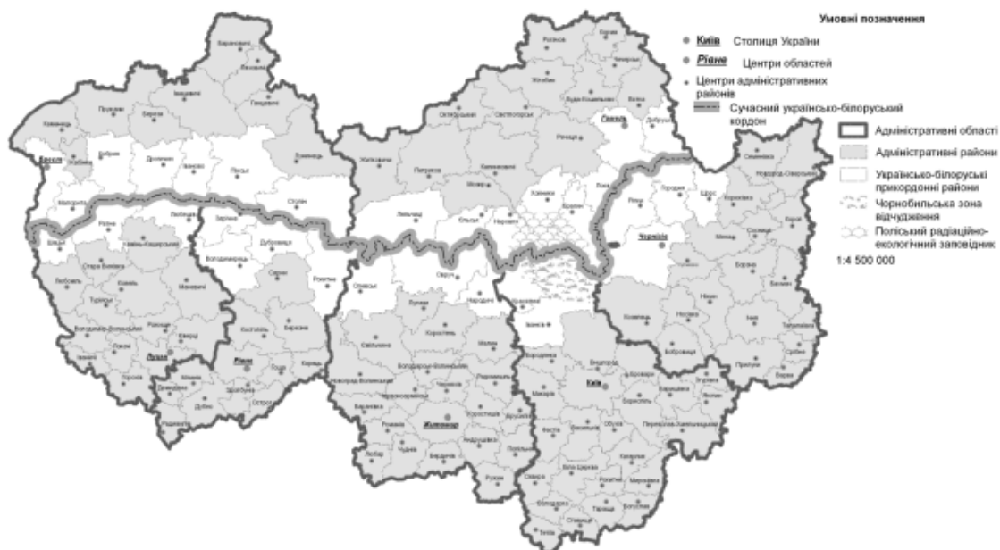
Рис. 1. Українсько-білоруський прикордонний регіон (за О. М. Черевко)

Головним документом, що регулював питання делімітації, а згодом – і демаркації кордону, був підписаний 18 липня 1997 року «Договір між Україною та Республікою Білорусь про державний кордон». Український парламент ратифікував його