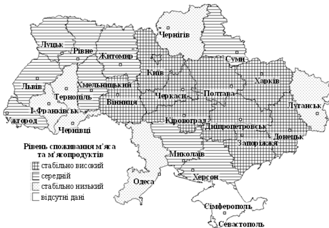
Рис. 1. Регіональна диференціація споживання м'яса та м'ясних продуктів на одну особу в Україні у 2010-2015 рр.