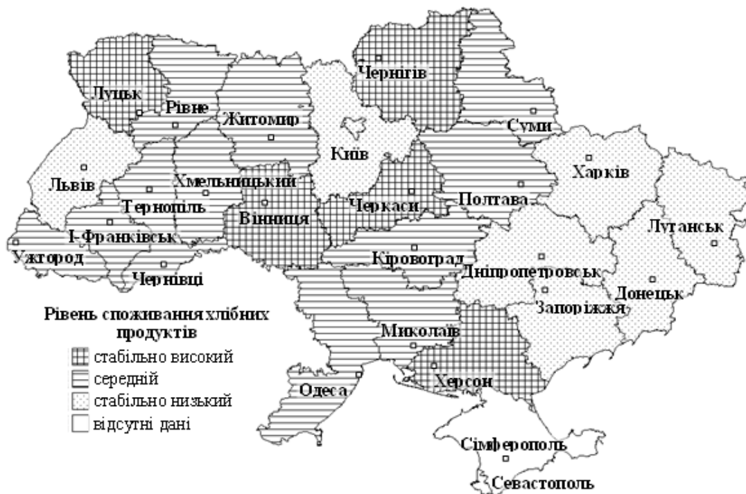
Рис. 3. Регіональна диференціація споживання хлібних продуктів на одну особу в Україні у 2010-2015 рр.