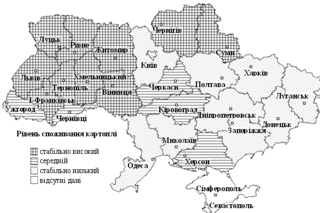
Рис. 4. Регіональна диференціація споживання картоплі на одну особу в Україні у 2010-2015 рр.

України і залежить від природних умов і ресурсів регіону.