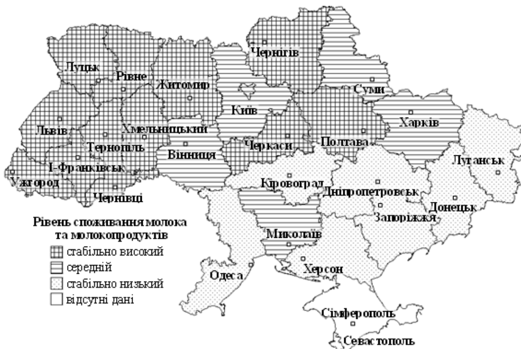
Рис. 2. Регіональна диференціація споживання молока та молочних продуктів на одну особу в Україні у 2010-2015 рр.

показники споживання впродовж 2010-2015 рр. характерні для таких регіонів, як Житомирська, Сумська, Волинська, Рівненська, Чернігівська, Івано-Франківська, Львівська, Тернопільська, Хмельницька та Вінницька області.