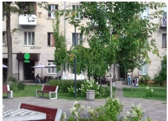
Рис. 6. Комерціалізація скверу Героїв Небесної Сотні у м.Житомир (фото Н. Проватар, 2021 р.)