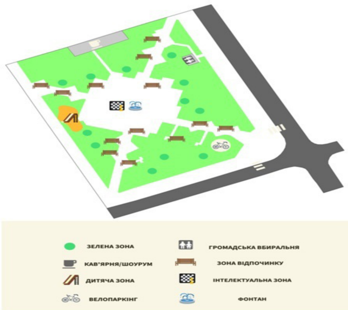
Рис. 5. Ареали скверу Героїв Небесної Сотні у м. Житомир за локалізацією різних видів активностей відвідувачів