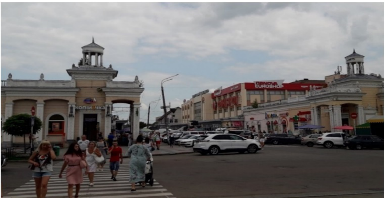
Рис. 3. Комерціалізована територія поряд із сквером Героїв Небесної Сотні у м. Житомир

За даними таблиці 2 здійснено аналіз соціального використання/взаємодії публічного простору. Найвища інтенсивність соціального використання скверу Героїв Небесної Сотні характерна для ранкового та після обіднього часових проміжків, де індекс інтенсивності соціального використання складає 0,561 та свідчить про середній рівень показника. Як правило, відвідувачі перебувають у публічному просторі в компанії друзів, родичів або прогулюючись з дитиною. Наявність соціальних груп у публічному просторі свідчить про те, що сквер Героїв