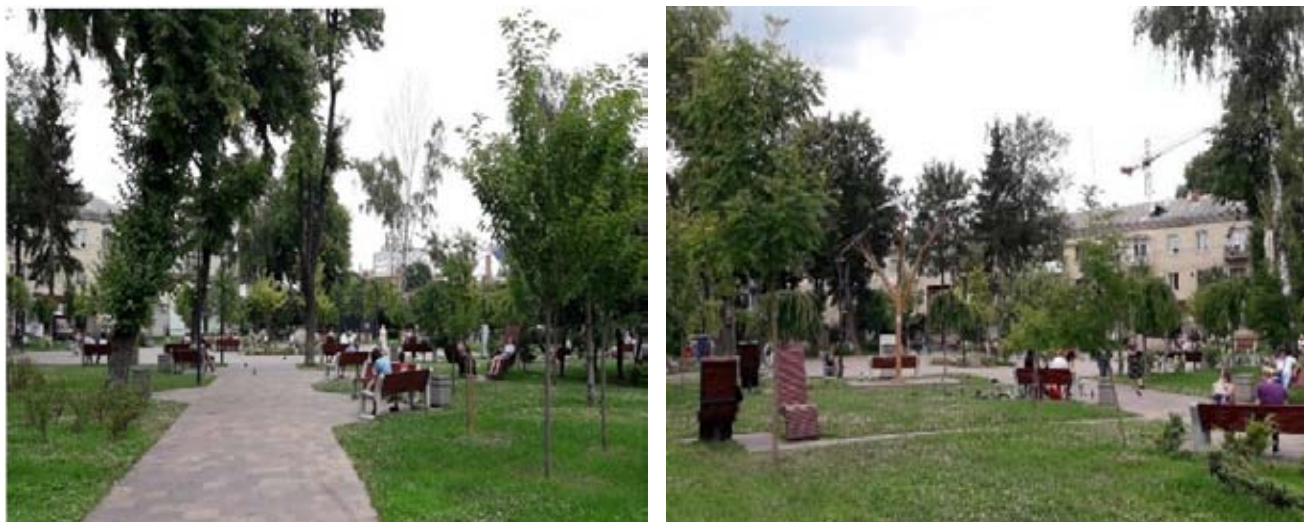
Рис. 1. Сквер Героїв Небесної Сотні в м. Житомир після реконструкції