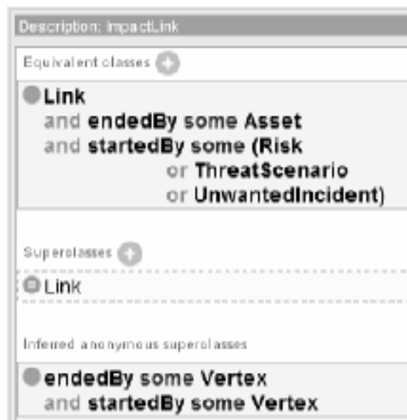
Рис. 2. Описание концепта ImpactLink

Предложенное описание на языке ALC диаграмм CORAS позволяет описывать возможные риски в системе и делать на основе представленных таким образом знаний логические выводы. Существует достаточно много программных продуктов для создания онтологий на основе дескриптивных языков. Авторами была использована среда Protégé версия 4.0. Используя введенные в данной