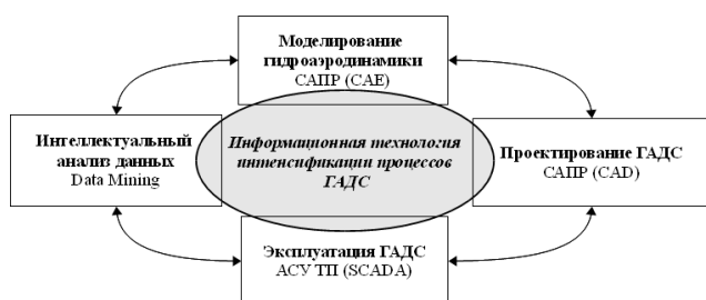
Рис. 1. Схема объединения форм представления данных в разных предметных областях

область на разных стадиях жизненного цикла ГАДС.