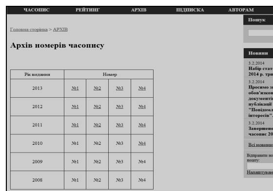
Рис. 3. Електронний архів номерів періодичного видання

Система Public4u, засобами якої було реалізовано проєкт пропонованого web-ресурсу, це редактор з величезними можливостями, який не вимагає особливих підходів та дає змогу редагувати web-презентацію в режимі on-line без послуг програміста, що сприяє швидкому оновленню інформації.