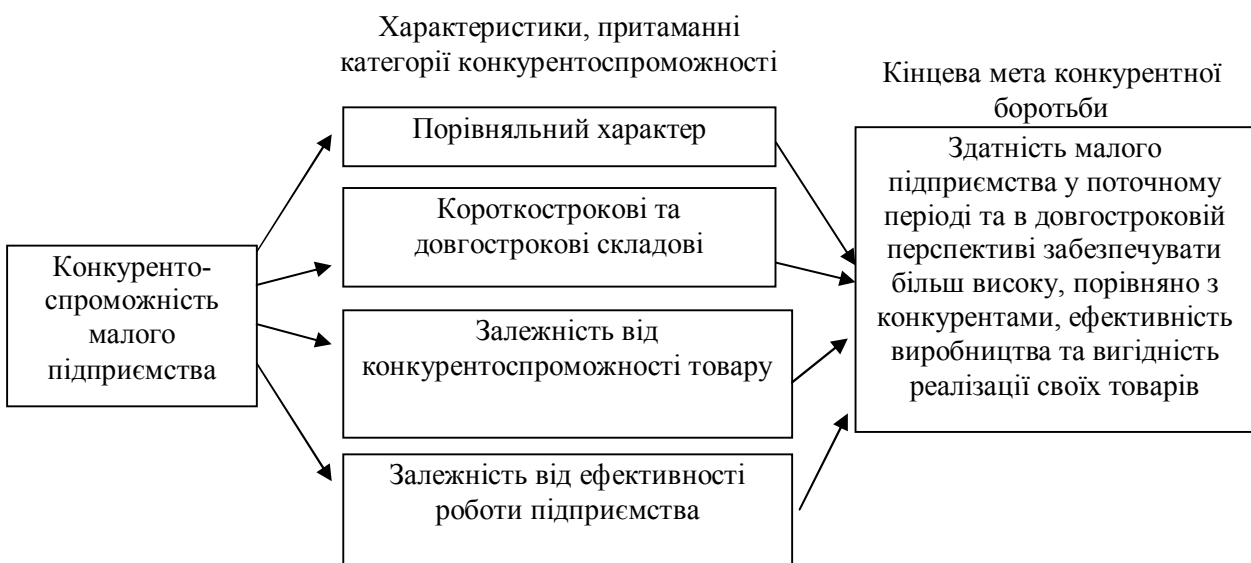
Рис. 1. Визначення конкурентоспроможності малого підприємства та його характеристики

У [1] запропоновано таке визначення конкурентоспроможності малого підприємства – його здатність у поточному періоді та в довгостроковій перспективі забезпечувати більш високу, порівняно з конкурентами, ефективність виробництва та вигідність реалізації своїх товарів (рис. 1).