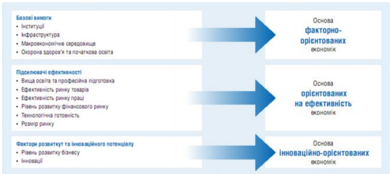
Рис. 1. Складові конкурентоспроможності за індексом GCI

Однак, при розрахунку індексу глобальної конкуренції використовуються як статистичні дані, що є у відкритому доступі, так і результати опитування керівників бізнесу в країні. Таким чином, індекс багато в чому відображає думку тих людей, які приймають рішення про інвестування в країну.