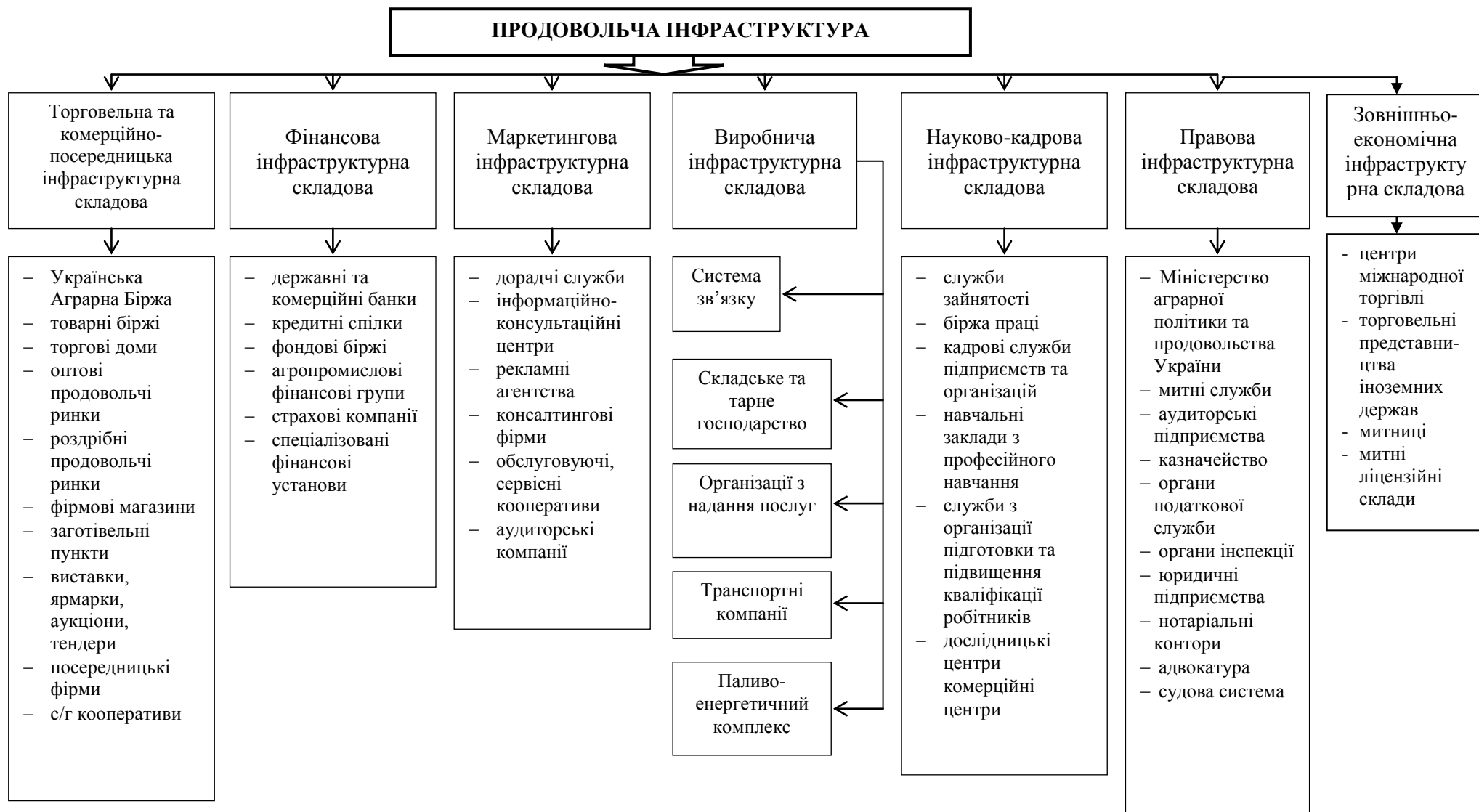
Рис. 1. Схематичне зображення інфраструктури вітчизняного продовольчого комплексу [розроблено автором]