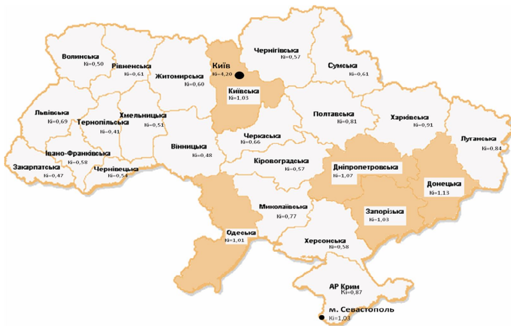
Рис. 1. Розміщення регіонів-донорів по території України

та Київська область) та південному районі (Одеська область).