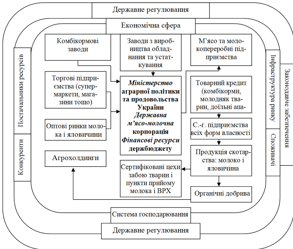
Рис. 1. Механізм державної підтримки скотарства в Україні

ринку м'ясо-молочної продукції в Україні на сучасному етапі його функціонування шляхом впровадження: еквівалентних цін на молоко, м'ясо і м'ясо-молочні продукти, мінімально гарантованого цінового рівня на сировину і гарантованих цін оптової закупівлі м'ясо-молочних продуктів, обмежувальних цін на виробничі засоби скотарства; порогових цін на м'ясо-молочні продукти; пільгового кредитного забезпечення та надання субсидій аграрним товаровиробникам.