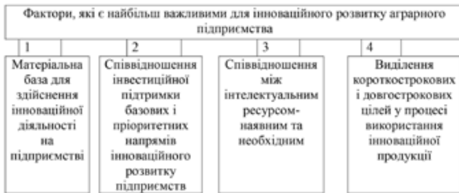
Рис.1. Фактори інноваційного розвитку аграрних підприємств

мічної системи, яка за відповідно організованої побудови сприятиме творчому процесу через виконання наступних функцій: