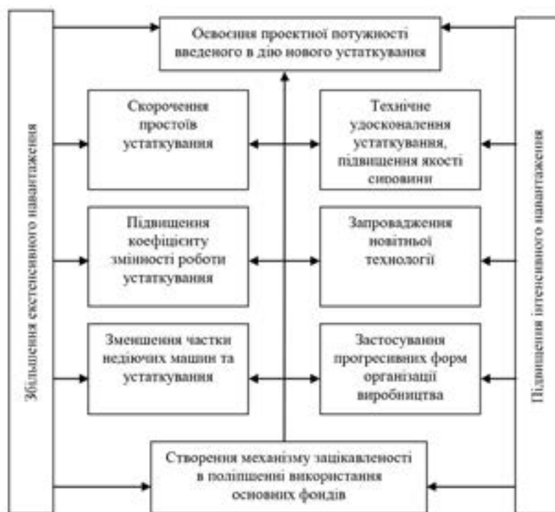
Рис. 2 Шляхи більш ефективного формування та використання основних засобів та виробничих потужностей промислового підприємства

Частіше за все до заходів із відтворення