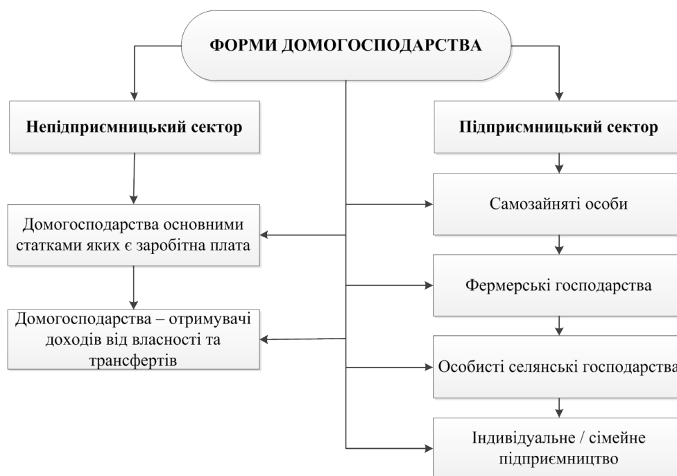
Рис. 2. Форми домогосподарств (складено автором)