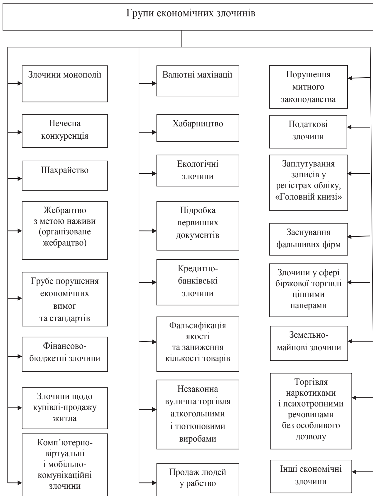
Рис. 1. Класифікація економічних злочинів [3, с. 9]