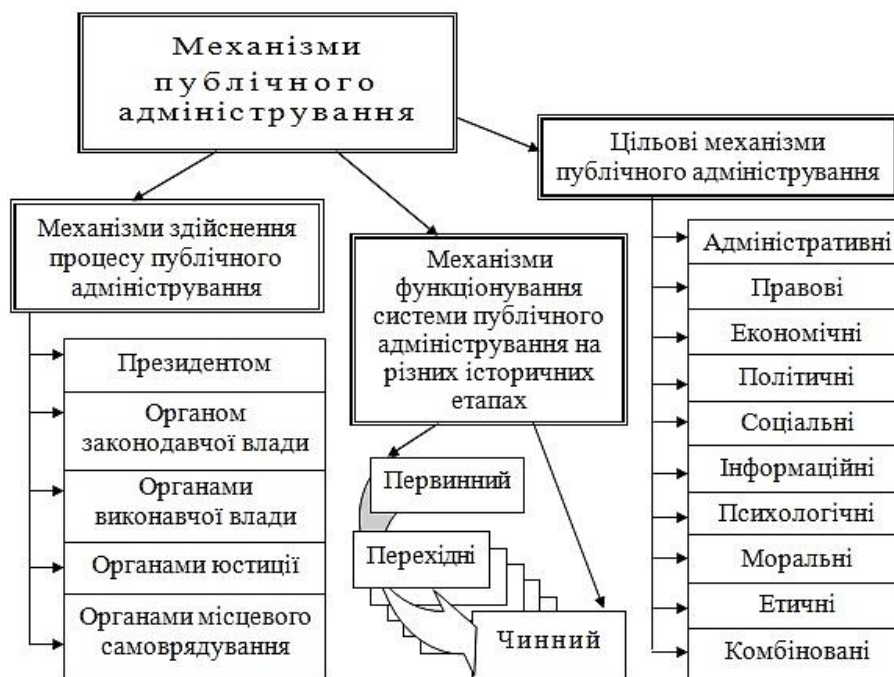
Рис. 3. Система механізмів публічного адміністрування