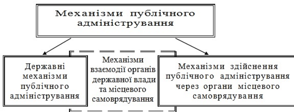
Рис. 2. Поділ механізмів публічного адміністрування за видами владних суб'єктів

розв'язання наявних у цій сфері суперечностей. Механізми публічного адміністрування – це спеціальні засоби, що забезпечують здійснення регулюючого впливу публічних адміністрацій на соціально-економічні територіальні системи різних рівнів (села, селища, райони в містах, міста, райони, області, уся країна) з метою забезпечення гідних умов життєдіяльності людей, що проживають у державі, та громадян України, що тимчасово проживають за її межами.