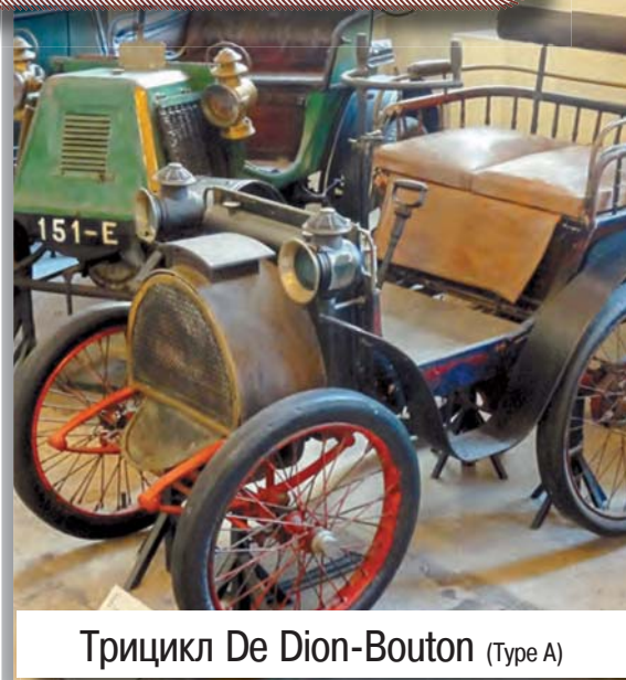
Трицикл De Dion-Bouton (Type A)

Луи Рено родился в семье парижских буржуа в феврале 1877 года. Среди пятерых детей он был самым младшим. Его отец был французским бизнесменом, а мать Луиза – дочерью богатых владельцев магазина. Поэтому семья была обеспеченной, и дети имели все возможности для светского обучения, хотя и были излишне избалованными. Младший ребенок Луи с детства любил технику и проявлял интерес ко всем механическим предметам, особенно это касалось моторов и электрики. Очень много времени будущий гений проводил в своей мастерской, которую оборудовал в