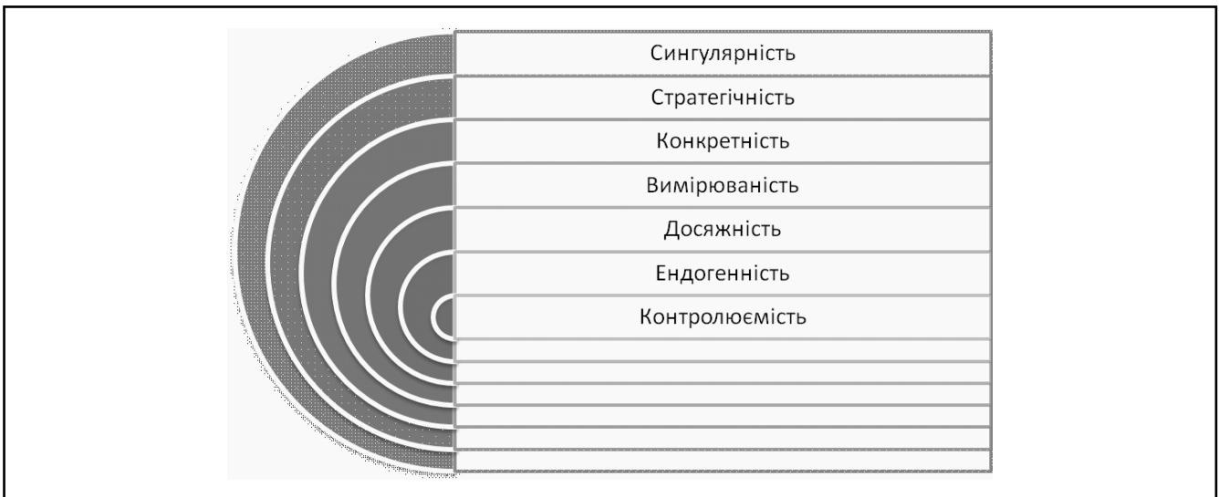
Рисунок 1. Характеристики мети державної цільової програми