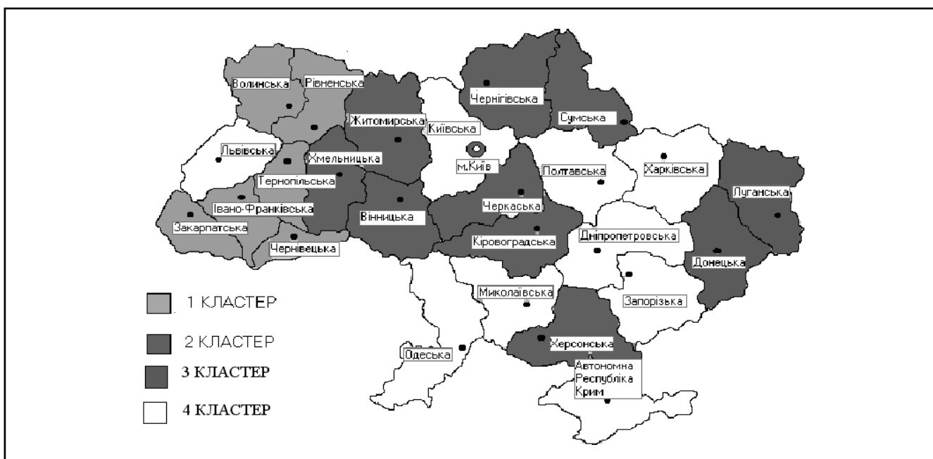
Рисунок 2. Виокремлення регіональних зон в Україні