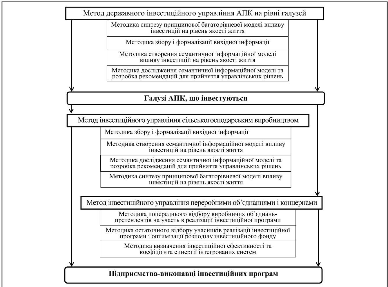
Рисунок 3. Методологічне забезпечення організаційно-економічного механізму державного інвестиційного управління АПК Сформовано автором.

Проблеми фінансового гарантування і захисту інвестицій мають ключове значення в залученні іноземного капіталу, тому доцільно створити у регіонах Регіональні гарантійні фонди (РГФ). Оцінка варіантів і джерел формування РГФ показала, що найбільш реальним механізмом реалізації такого проекту міг би стати товарний кредит. Гарантійний фонд, утворений на кошти від виручки за товарний кредит, може щорічно забезпечувати залучення іноземних інвестицій вартістю до 70–80% від обсягу такого кредиту у формі капіталу, товарів і послуг.