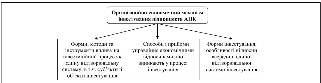
Рисунок 1. Організаційно-економічний механізм інвестування підприємств АПК

Пріоритетами в державному регулюванні інвестиційної діяльності в АПК слід вважати: координацію дій і контроль