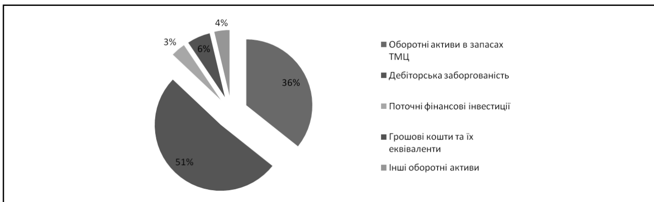
Рисунок 2. Структура оборотних активів підприємств Миколаївської області станом на 31.12.2011р.