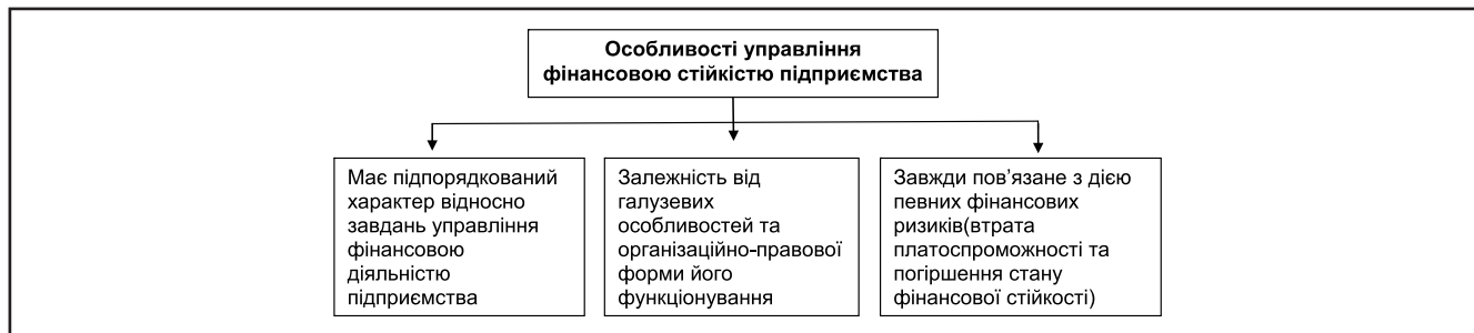
Рисунок 1. Особливості управління фінансовою стійкістю підприємства