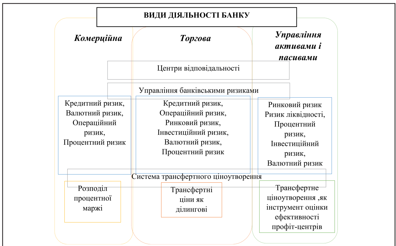
Рисунок 1. Схема взаємозв'язків в запропонованій організаційній структурі об'єктів управління з урахуванням трансфертного ціноутворення

Підкреслимо, що комерційною діяльністю банку являються [13]: