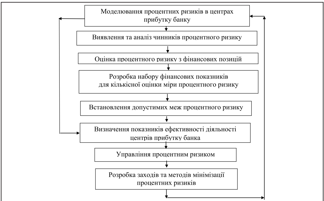
Рисунок 4. Схема процесу моделювання процентних ризиків в центрах прибутку банку