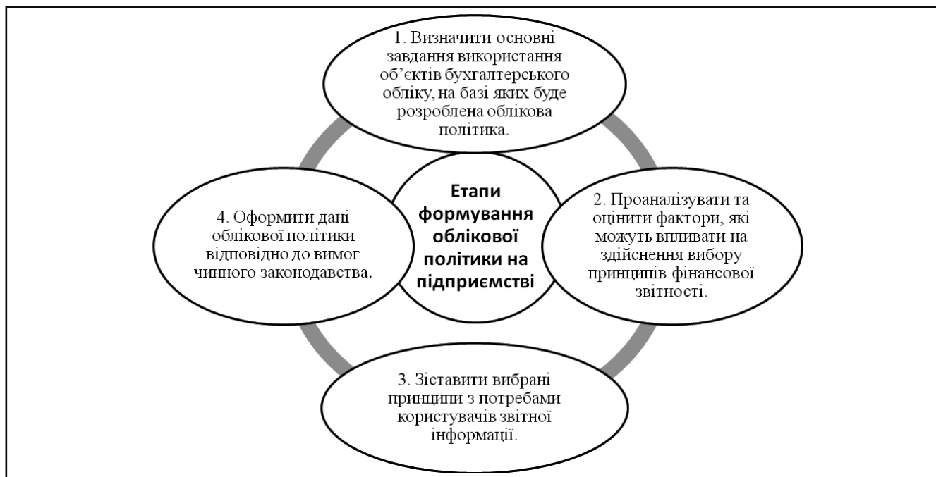
Рисунок 2. Основні етапи формування облікової політики на підприємстві