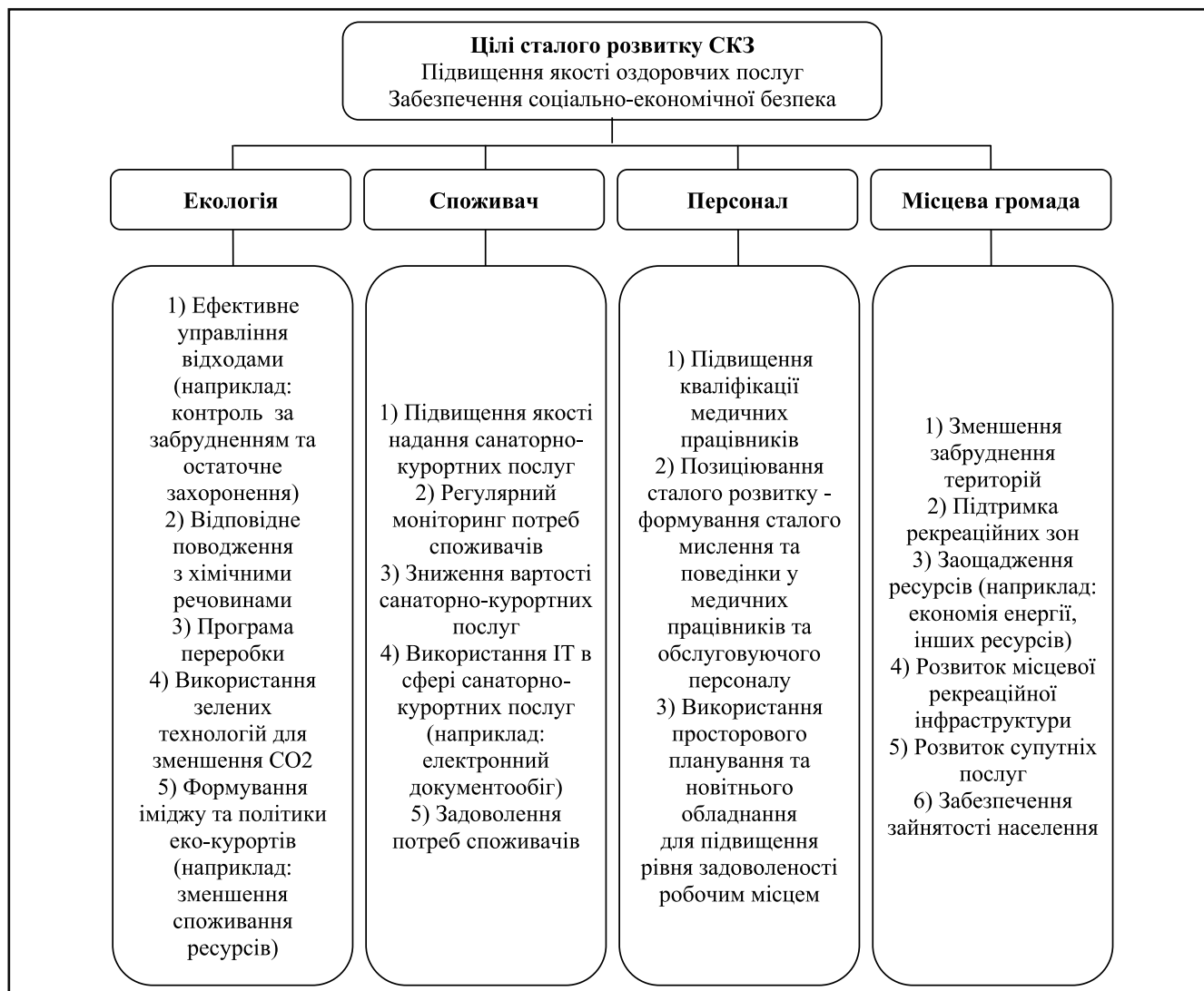
Рисунок 1. Розширена модель сталого розвитку санаторно-курортних підприємств за рахунок зміцнення СЕБ*