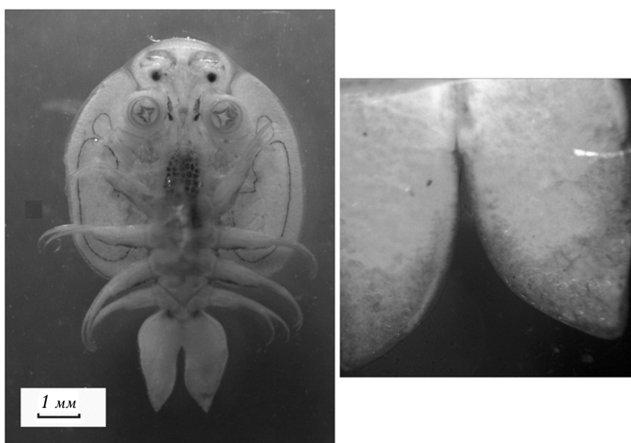
2. Вид самки A. coregoni с брюшной стороны (фото Г. С. Кашеварова).

В пробах дрефта также были выявлены 19 таксонов беспозвоночных. Наиболее качественно богатым было семейство Chironomidae (11 таксонов).