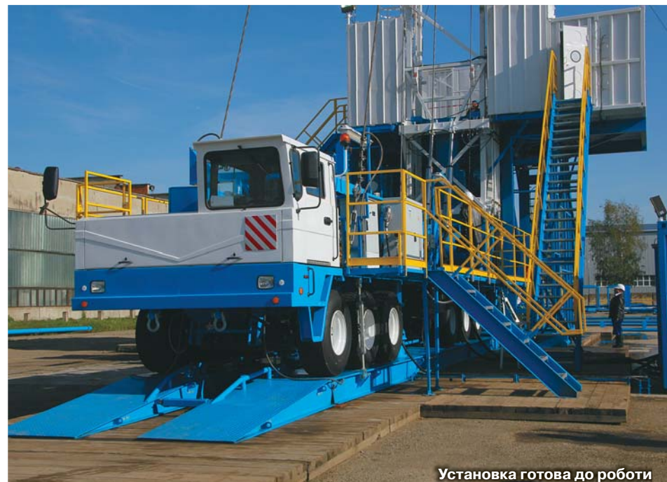
Установка готова до роботи

но, навіть підійде слово «елегантно». Все в ній зроблено бездоганно: охайні шви, ідеальне пофарбування, бурова лебідка з дисковими гальмами, пульт бурильника, який керує усіма роботами за допомогою джойстиків, підбір комплектуючих тільки провідних виробників. Спеціалісти не могли втриматися від захоплени вигуків і дуже уважно та прискіпливо оглядали всі деталі й вузли, підіймались нагору, заглядали в усі шпарини. Та й господарі охоче демонстрували своє дітище.