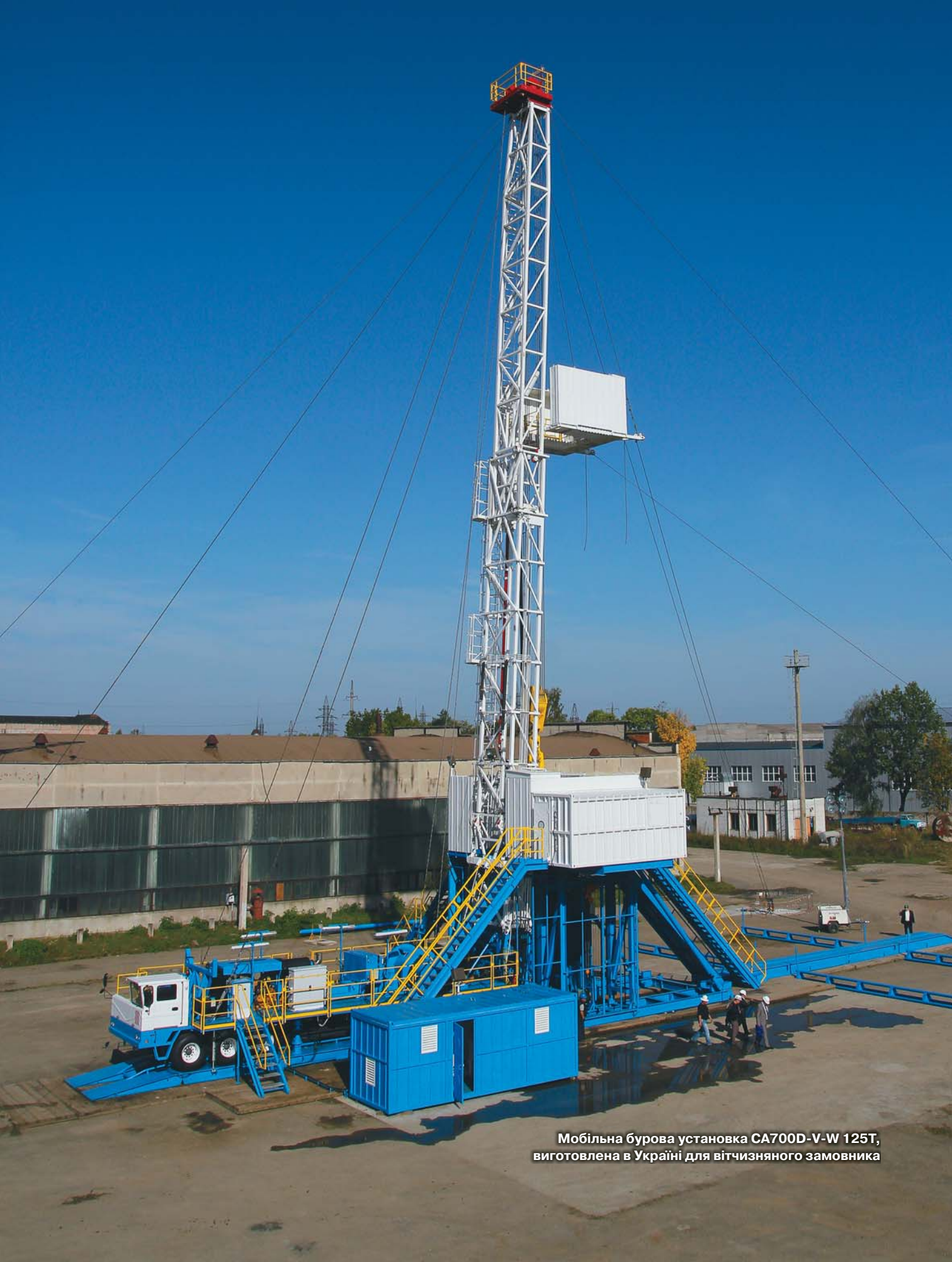
Мобільна бурова установка CA700D-V-W 125T, виготовлена в Україні для вітчизняного замовника