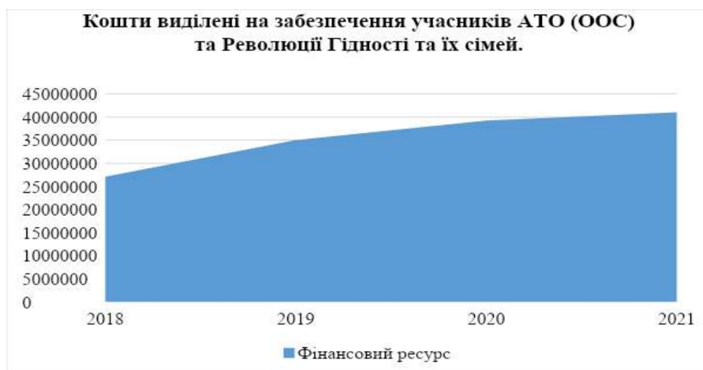
Рисунок 1. Кошти, виділені на забезпечення учасників АТО/ООС і Революції Гідності та їхніх сімей у Львівській області

Варто відзначити, що спостерігається позитивна динаміка щодо збільшення фінансування, яке виділяється з обласного бюджету на забезпечення учасників АТО/ООС та Революції Гідності та їхніх сімей у Львівській області за 2018–2021 рр. (рис. 1).